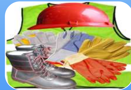
спеціальний одяг, взуття